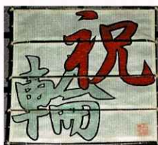
しゅくりん 1964年(昭和39年)