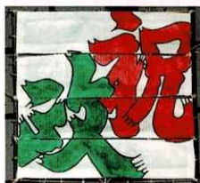
しゅくせい 2010年(平成22年)