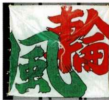
2020年(令和2年) 2021年(令和3年) ※大凧揚げ中止