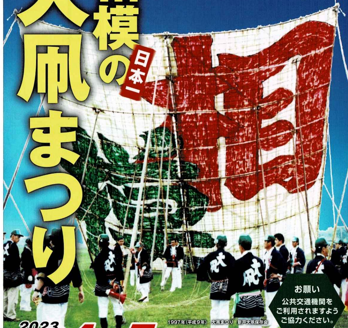
1997年(平成9年) 大凧まつり 新戸大凧保存会