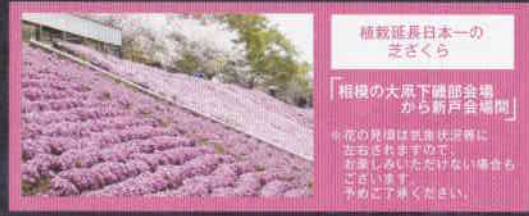
植栽延長日本一の さくら 「相模の大嵐下磯部会場から新戸会場間」 ※夜の見頃は気象状況等に左右されますので、お楽しみいただけない場合もございます。予めご了承ください。